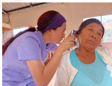
JORNADA MÉDICA BARRIO LA CHAMANA

Calle 25 de Junio e Independencia (Frente al Parque Central) Telf.: + (593 7) 2683 045 www.alcaldiadepaltas.gob.ec