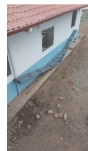
BARRIO LA SUPA

Calle 25 de Junio e Independencia (Frente al Parque Central) Telf.: + (593 7) 2683 045 www.alcaldiadepaltas.gob.ec