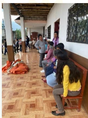
BARRIO EL CARMELO