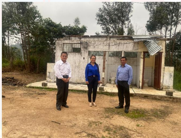
NARANJO PALTO BAJO