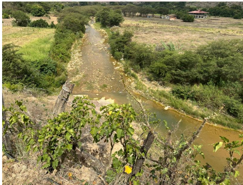
Figura 4. Área de concesión minera ROMANO.