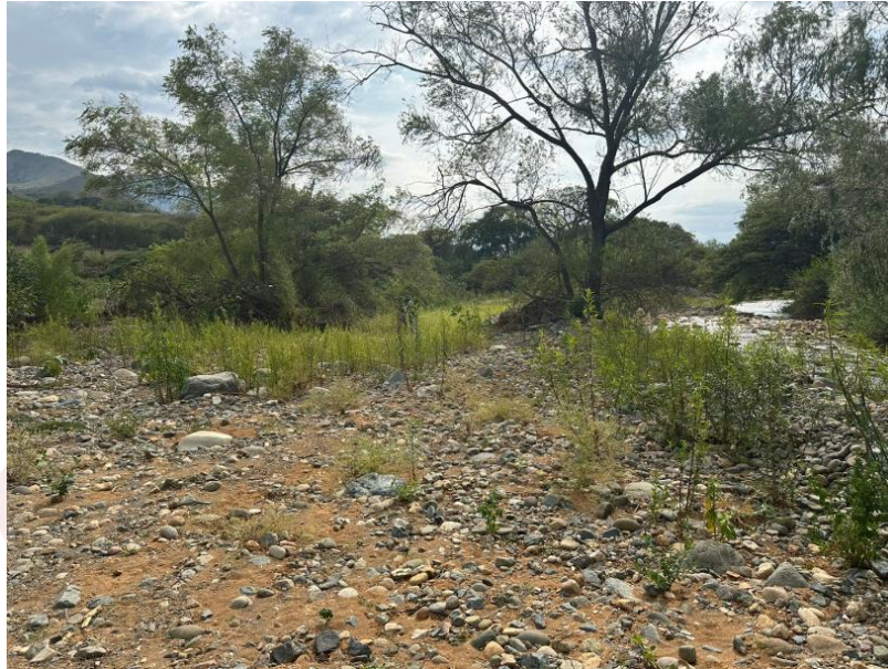
Figura 5. Área de concesión minera ROMANO.