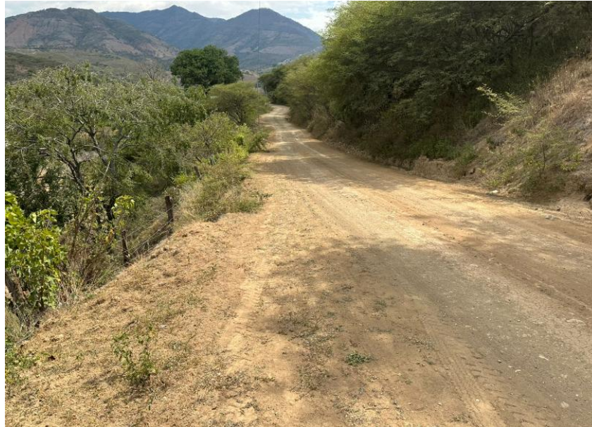
Figura 3. Vía de ingreso a concesión minera ROMANO.