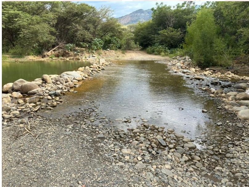
Figura 6. Área de concesión minera ROMANO.