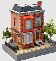
SECRETARIA DE DERECHOS HUMANOS