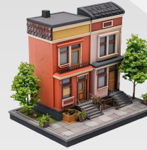
UNIDAD JUDICIAL MULTICOMPETENTE DEL CANTÓN PALTAS