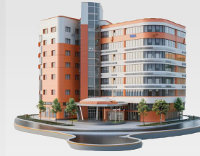
MINISTERIO DE SALUD PÚBLICA