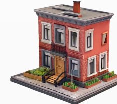
CONSEJO CANTONAL DE PROTECCIÓN DE DERECHOS