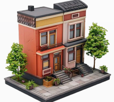
MINISTERIO DE EDUCACIÓN