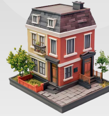
POLICÍA NACIONAL ECU 911