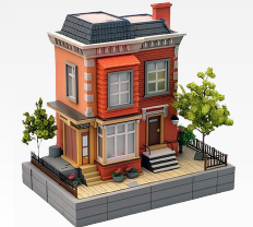
JEFATURA POLÍTICA DEL CANTÓN PALTAS