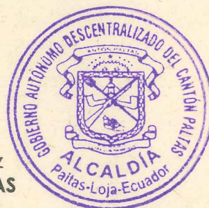
Arq. Ramiro Maita Sánchez ALCALDE DEL CANTÓN PALTAS

Proveyó y firmó EL REGLAMENTO INTERNO QUE ESTABLECE LOS PROCEDIMIENTOS DE ADMINISTRACIÓN DEL TALENTO HUMANO EN LOS SUBSISTEMAS DE PLANIFICACIÓN, CLASIFICACIÓN DE PUESTOS, RECLUTAMIENTO Y SELECCIÓN DE PERSONAL, FORMACIÓN, CAPACITACIÓN, DESARROLLO PROFESIONAL Y EVALUACIÓN DEL DESEMPEÑO DEL GOBIERNO AUTÓNOMO DESCENTRALIZADO DEL CANTÓN PALTAS , el señor Arquitecto Nerio Ramiro Maita Sánchez, Alcalde del Cantón Paltas, el día miércoles veintisiete de enero del año dos mil dieciséis.